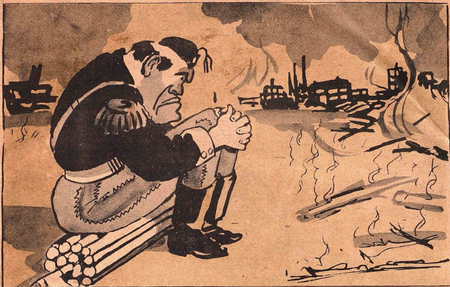
Ты сидишь одиноко и смотришь с тоской, как печально Турин догорает...