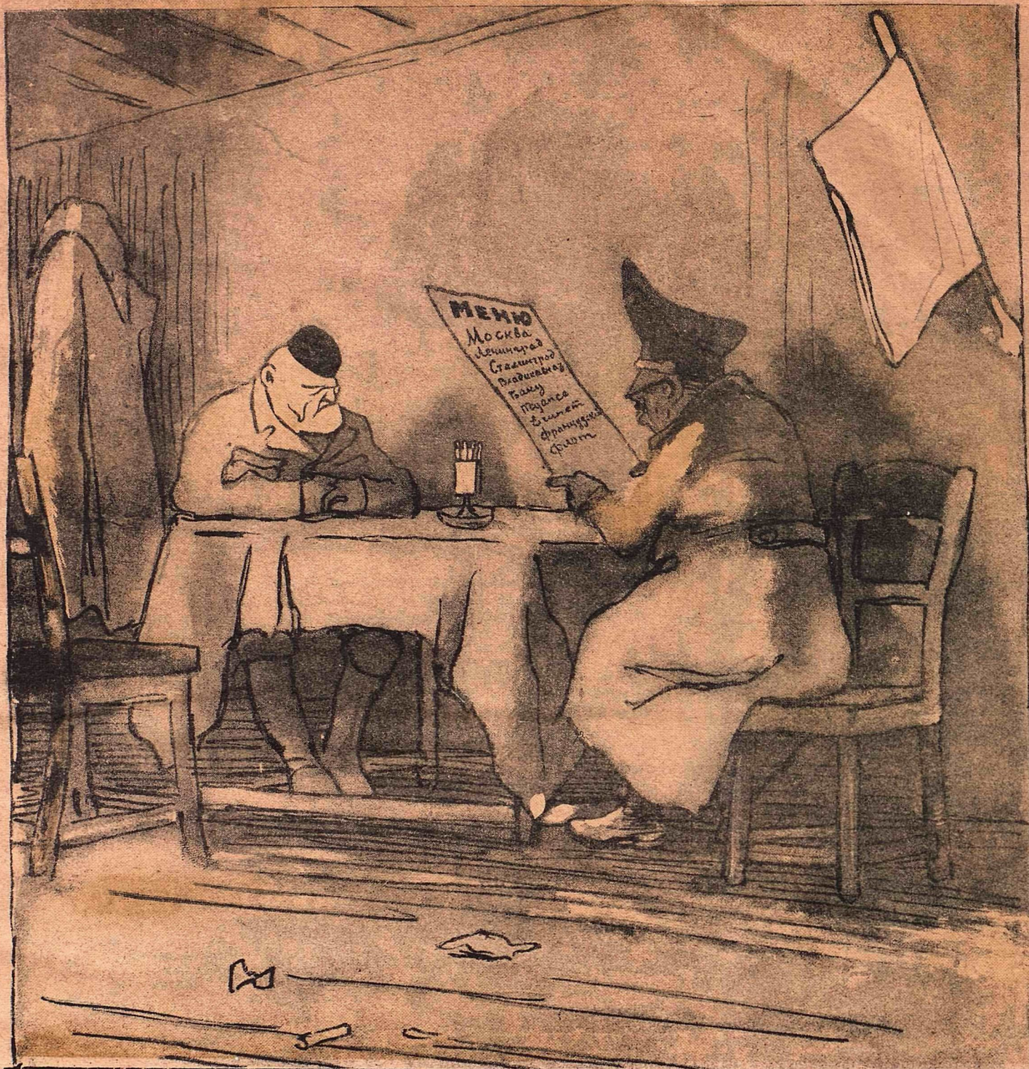
— Ох, боюсь, что мой друг Адольф, ничего не получив по этому меню, захочет закусить Италией!