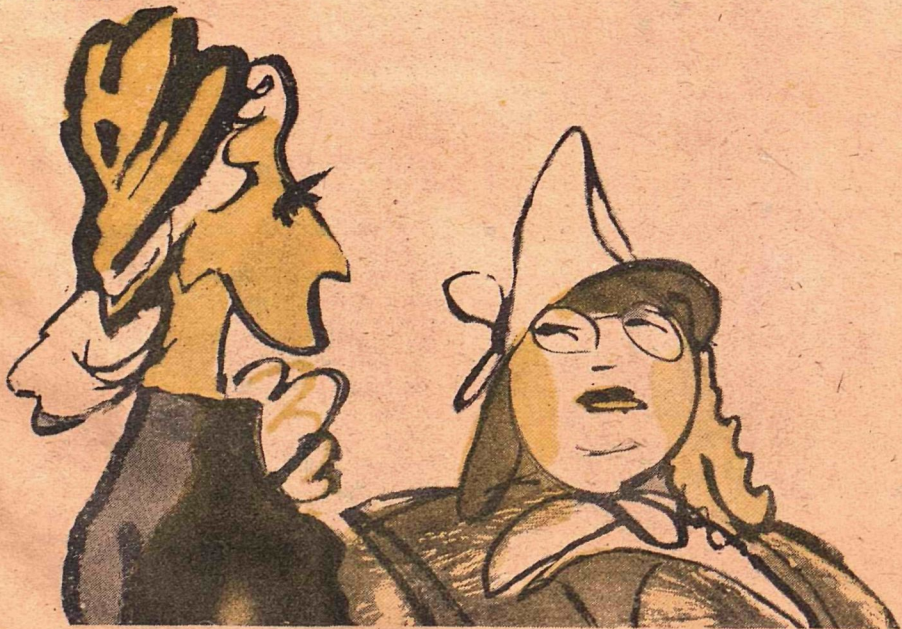
Рис. В. Горяева

— Говорят, ваш муж — меткий стрелок, фрау Шульц.