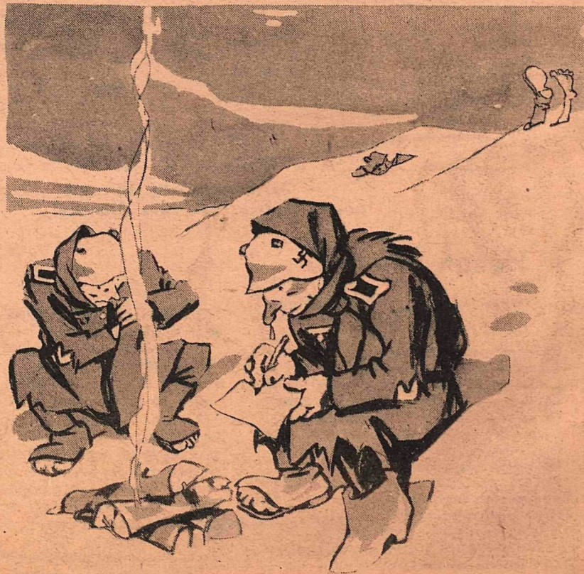
Рис. А. Баженова

«...Не беспокойся, Гретта, мы очень мало изменились с прошлой зимы...»