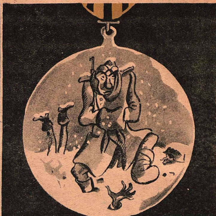
ее обратная сторона.