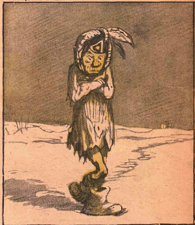
Солдат Адольф Штрипке потерял мундир и все награбленное при отступлении на Центральном фронте.