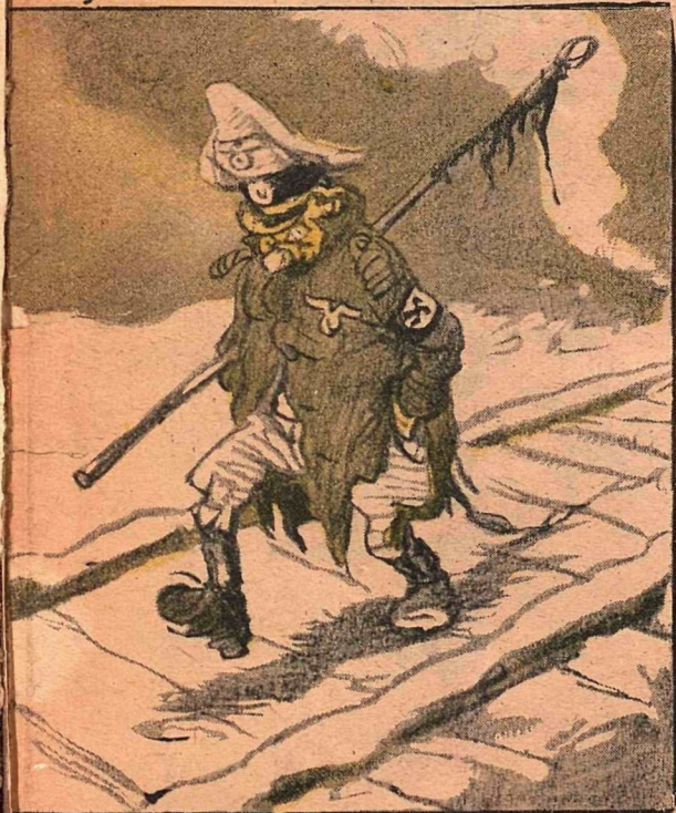
Полковник Курт Швайнер потерял весь свой полк под Сталинградом.