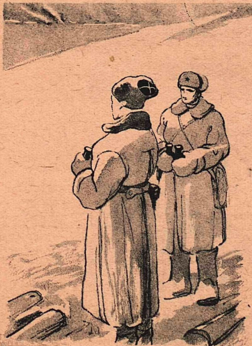
Рис: И. Семенова

— В военном деле глазное— пунктуальность, товарищ пол- ковник!